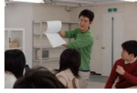
アニメーション制作体験②