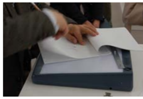
キャラクターデザイン②