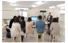
キャラクターアニメーションの基本