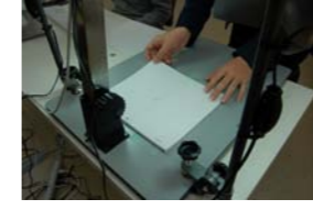
キャラクターのデザイン①

iStopmotion を使った動画 の取り込み作業。基本的な Mac の基本操作の説明。